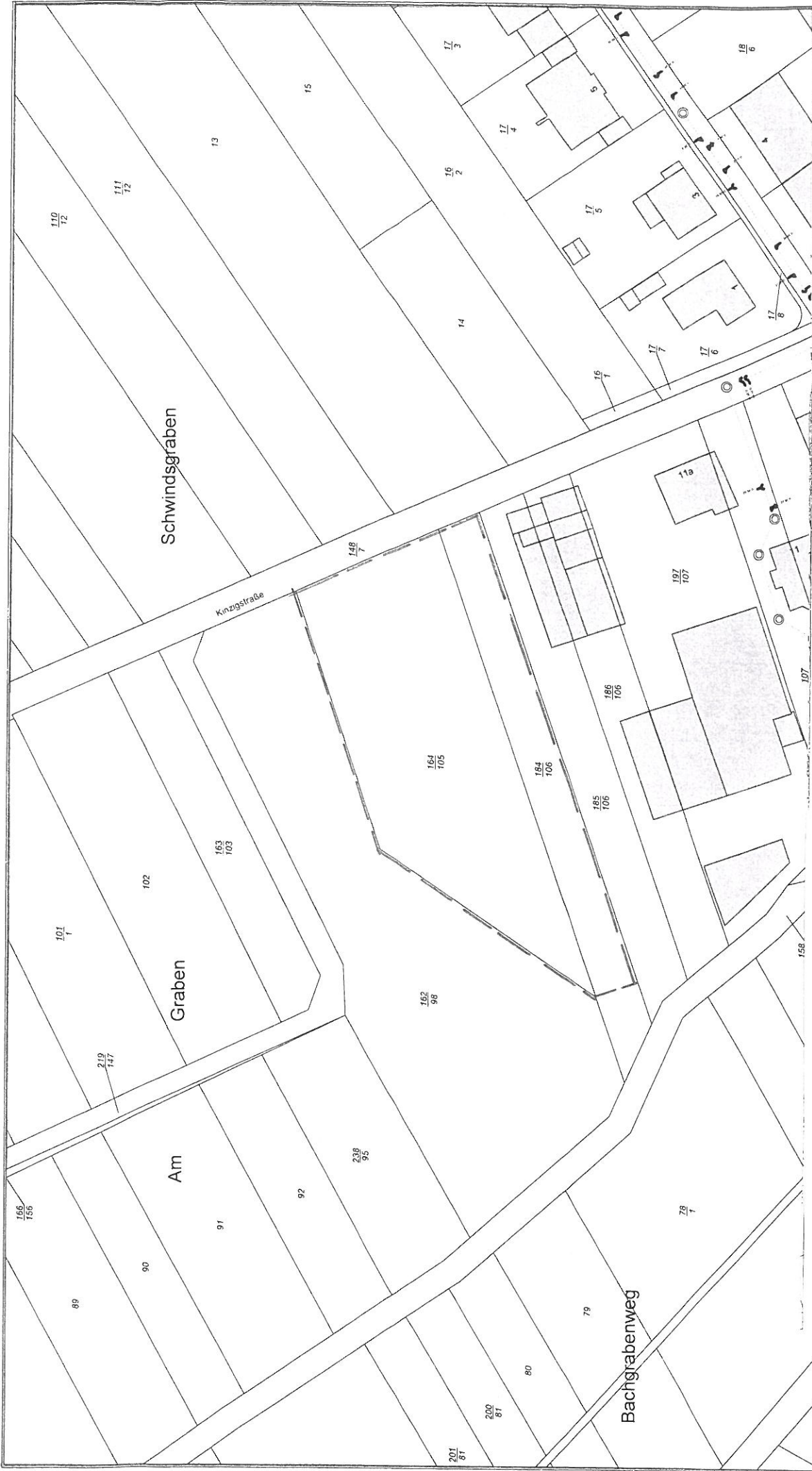
Lageplan Maßstab 1:1000

Klarstellungssatzung gemäß § 34 Abs. 4 Nr. 1 BauGB